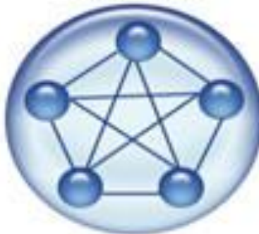
Etapa 4 Desempeño