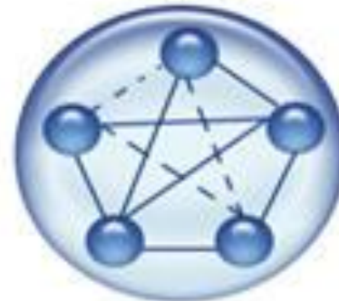
Etapa 5 Desintegración